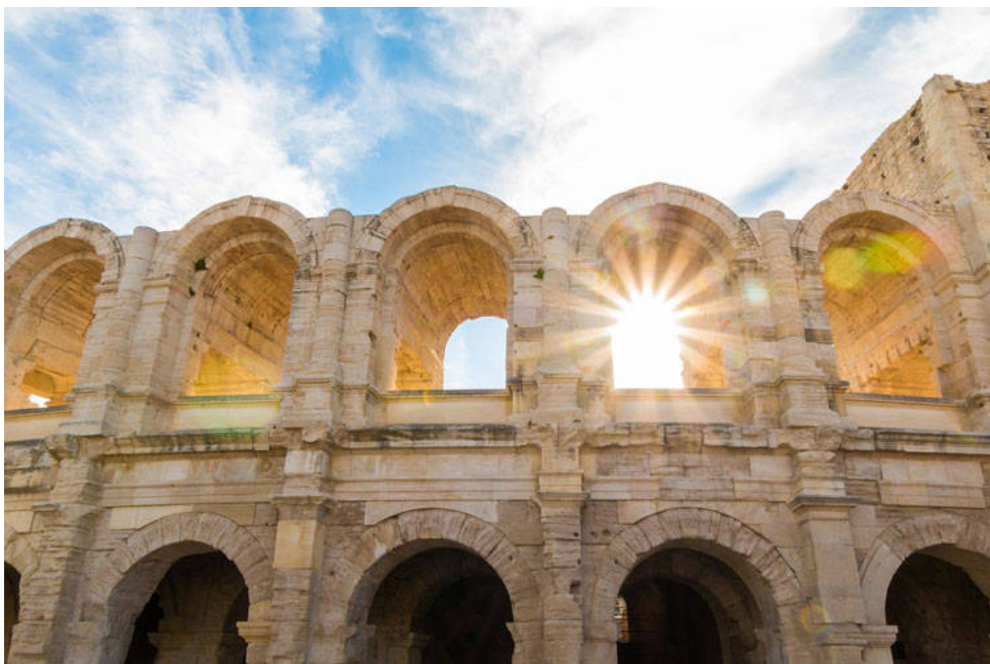
Il Colosseo e Foro Romano è il museo italiano più visitato

f (HTTP://WWW.FACEBOOK.COM/) t (HTTP://TWITTER.COM) in (HTTP://WWW.LINKEDIN.COM/) 📄 📧 (/USER/LOGIN)